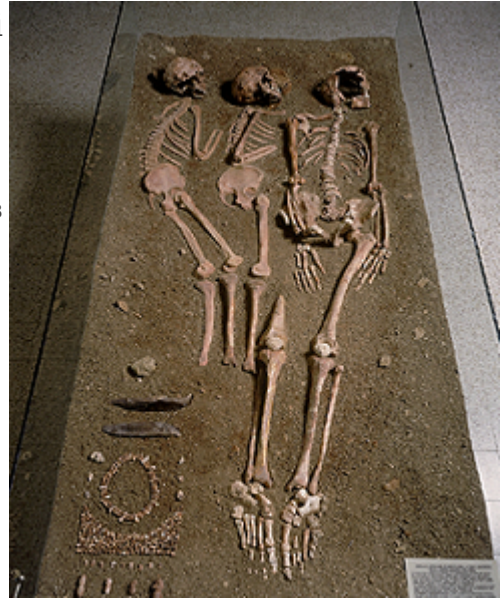
La tomba trisoma

Andiamo ora a vedere da vicino questi ultimi due casi della Grotta dei Fanciulli, donna adulta e adolescente, le cui caratteristiche antropometriche sono: forte dolicocefalia, di forma ellittica (crani aristencefali), con capacità cerebrale pari a 1375 cm 3 nella donna e 1570 cm 3 nel ragazzo; faccia cameprosopa, ossia larga (con euriprosopia, ossia "faccia corta", di nuovo il caso tipico dell'euridolicomorfa del Cro-Magnon o "disarmonismo cromagnide", che non è assolutamente "negroide"); un certo prognatismo alveolare, presente solo nella donna e di cui ben sappiamo ora la causa e che, anche se congenito ed ereditario, non è assolutamente caratteristica negride o negroide); orbite cameconche a contorno sub-rettangolare (ovvero infossate rispetto alla fronte, larghe, orizzontali e rettangolari, sempre tipiche del Cro-Magnon); una certa camerrinia (altro tratto tipico del Cro-Magnon, oggi ancora riscontrabile nel tipo dalo-falico scandinavo e Nord-europeo); struttura del bacino alta.