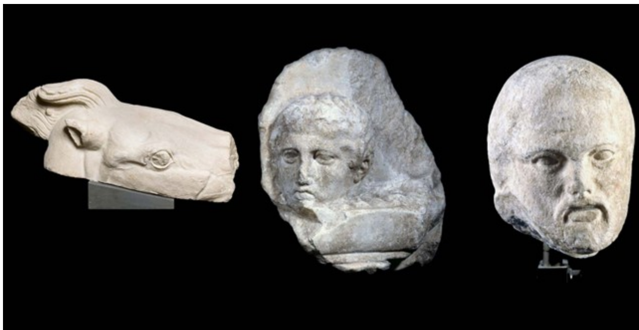
I tre marmi donati ai greci da papa Bergoglio

dove il donante o il venditore aveva l'orgoglio di vedersi esposte le opere; in ultima analisi sono un museo "italiano" per il patrimonio che possiedono, tutto appartenente alla nostra cultura e alla nostra storia.