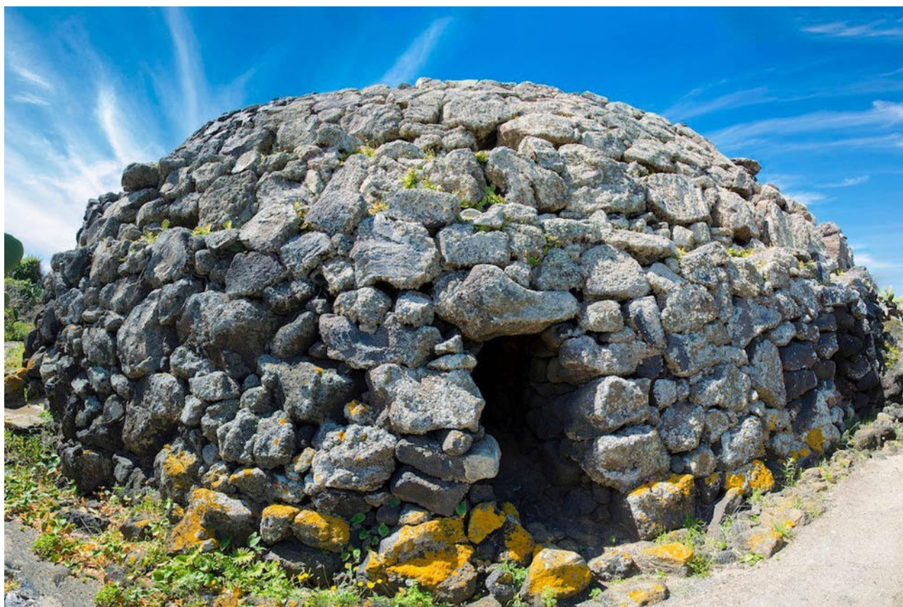
Le costruzioni megalitiche di Pantelleria denominate Sesi

Quando gli Shardana prenuragici costruirono i sesi di Pantelleria