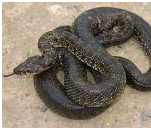
Colubro sardo di Pantelleria

Sarebbero stati i Fenici durante i loro viaggi e soste? No, perché ed a che scopo? Il colubro si sarebbe "imbarcato" da solo nelle navi puniche? Ciò è da escludere.