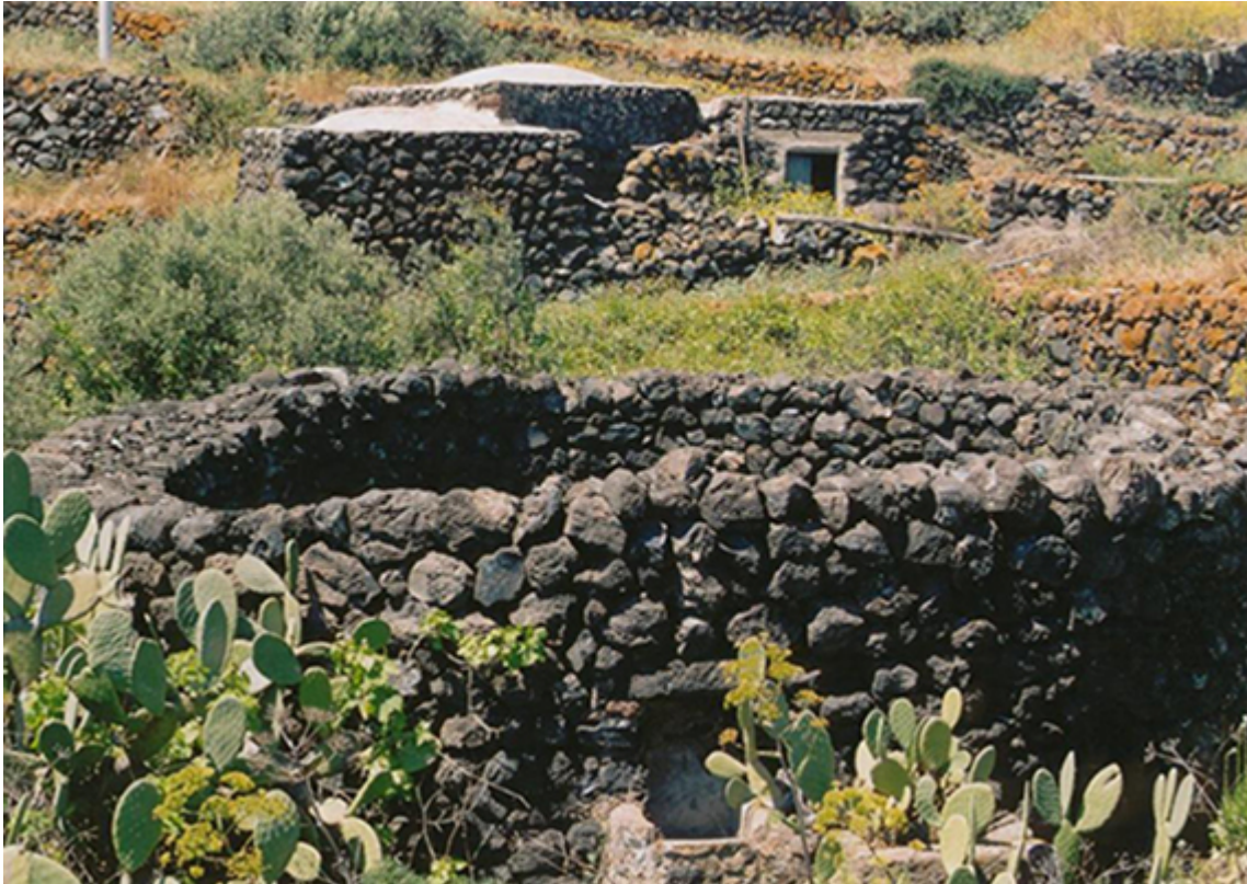
Tipico giardino pantesco

Quando gli Shardana prenuragici costruirono i sesi di Pantelleria