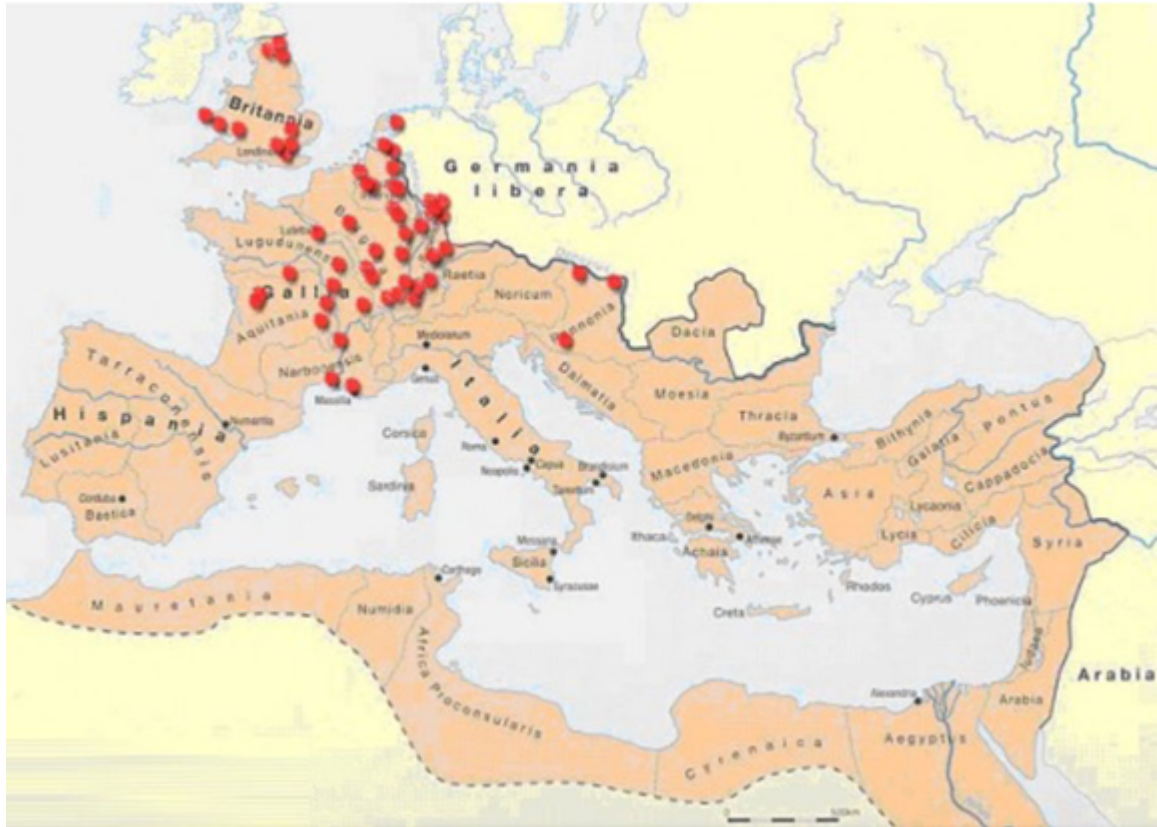
Distribuzione dei rinvenimenti del dodecaedro nell'impero romano

La presenza a poi del dodecaedro romano nel tesoro numismatico di Membrey, Saint Parize-le-Châtel, rinvenuto nella tomba di una donna facoltosa nei pressi di una villa rustica, dimostrano che il dodecaedro era un oggetto che difficilmente