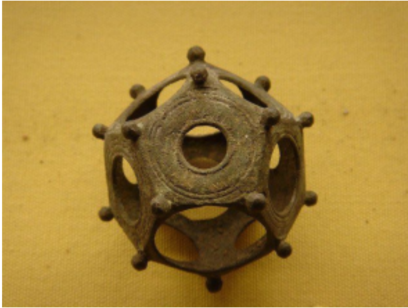
Dodecaedro romano conservato nel casello di Saalburg nell'Assia, poco distante da Bad Homburg (Germania)

Il dodecaedro serviva per stabilire la data dell'equinozio e centuriare. L'esperimento