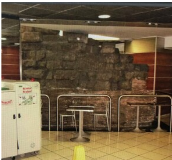
Il terrapieno di Porta Viminalis all'interno di Termini, ancora ostaggio di tavolini

Col passare del tempo Roma si ingrandì oltre la cinta muraria e il ruolo delle Mura Serviane progressivamente si esaurì: già dall'Età di Augusto non ebbero più funzione difensiva e vennero progressivamente occupate e riutilizzate. Le porte vennero monumentalizzate o ridotte ad accessi stradali (Porta Celimontana e Porta Esquilina).