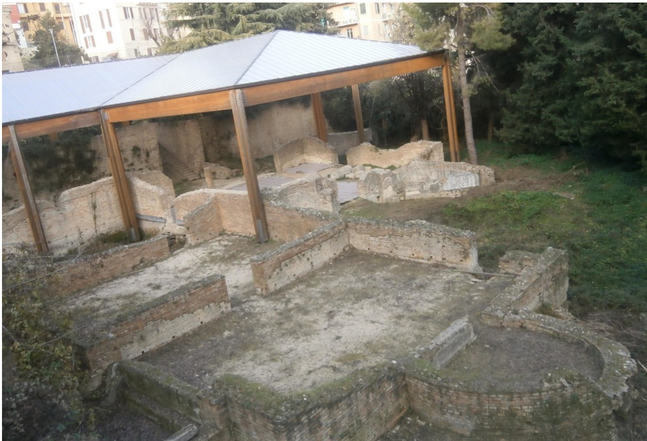
Le terme romane di Chieti

Le terme ( thermae ) nella civiltà romana assumono poi un aspetto monumentale e simbolico: sono l'emblema del benessere della società romana. Non a caso, infatti, ogni città che si rispettasce possedeva un complesso termale pubblico all'ingresso del centro urbano, un chiaro biglietto da visita per i viaggiatori per comprendere subito la qualità e misurare il prestigio del municipio che si visitava.