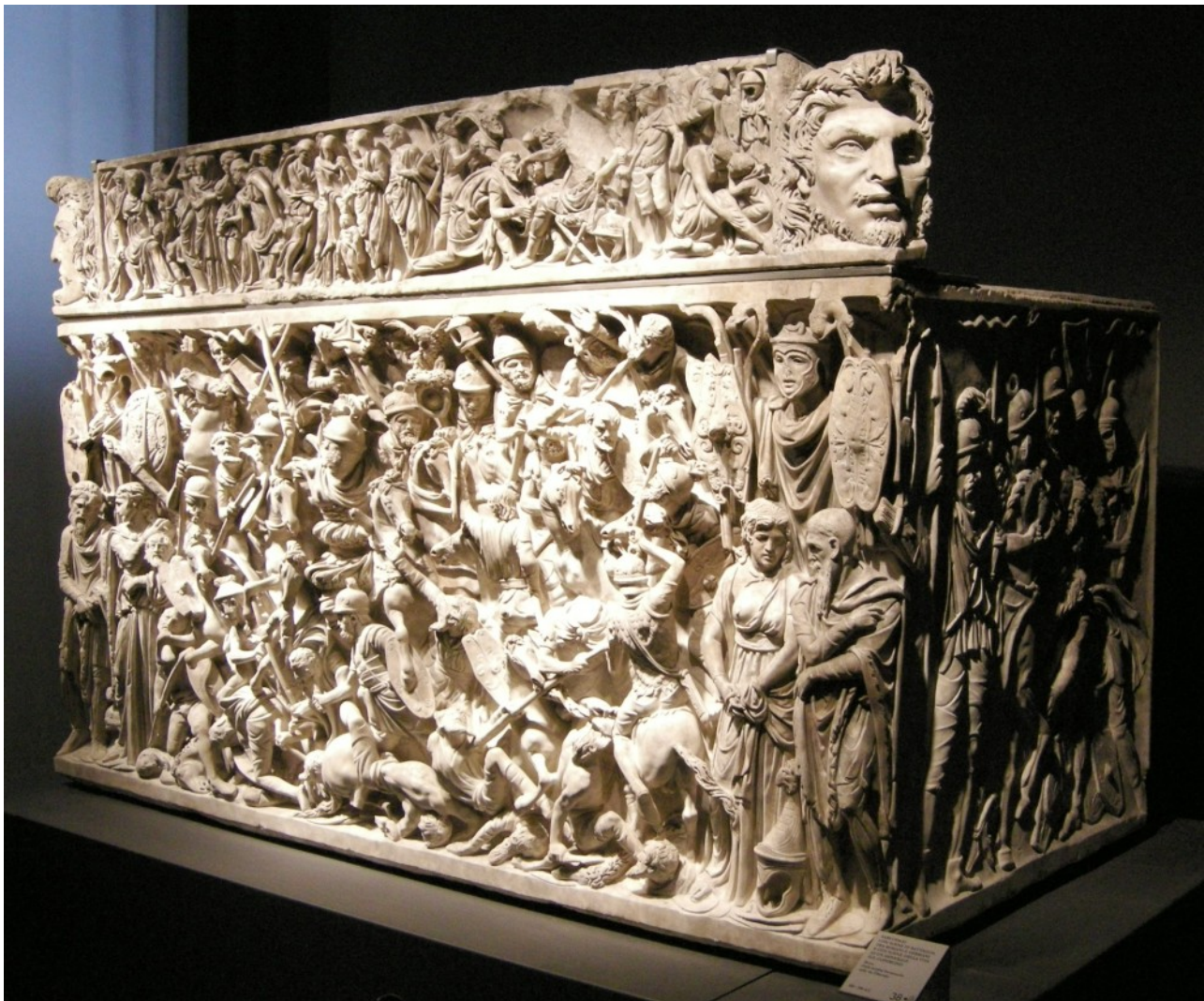
Sarcofago di Portonaccio

Ebbene, occorre in primo luogo rimuovere dai nostri intelletti l'oggettivazione scientifica forzata di ogni problema. Le divinità che popolano il cosmo ad ogni livello non sono l'oggetto della Religio Romana. Esse ne sono il soggetto. E come soggetto, sono loro che dirigono l'azione che a noi spetta riconoscere. Questa considerazione apre nuove prospettive, in quanto ci costringe al confronto con la dimensione divina, non solo come persone informate che possono parlare sull'argomento, ossia teologi, bensì come teurghi .