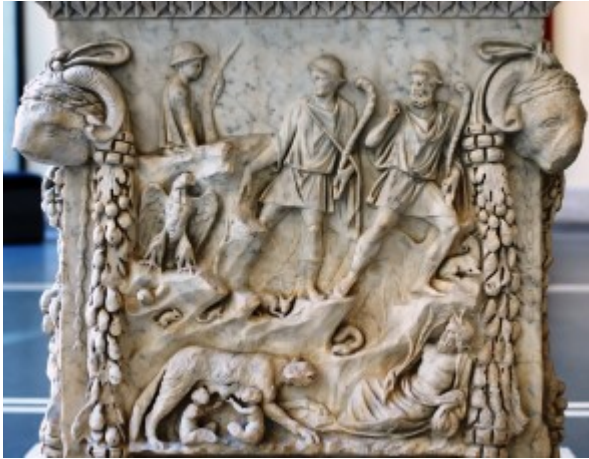
Altare con bassorilievo della Fondazione di Roma, Ostia antica

Le divinità non sono l'oggetto della Religio Romana, ma il soggetto. La teurgia