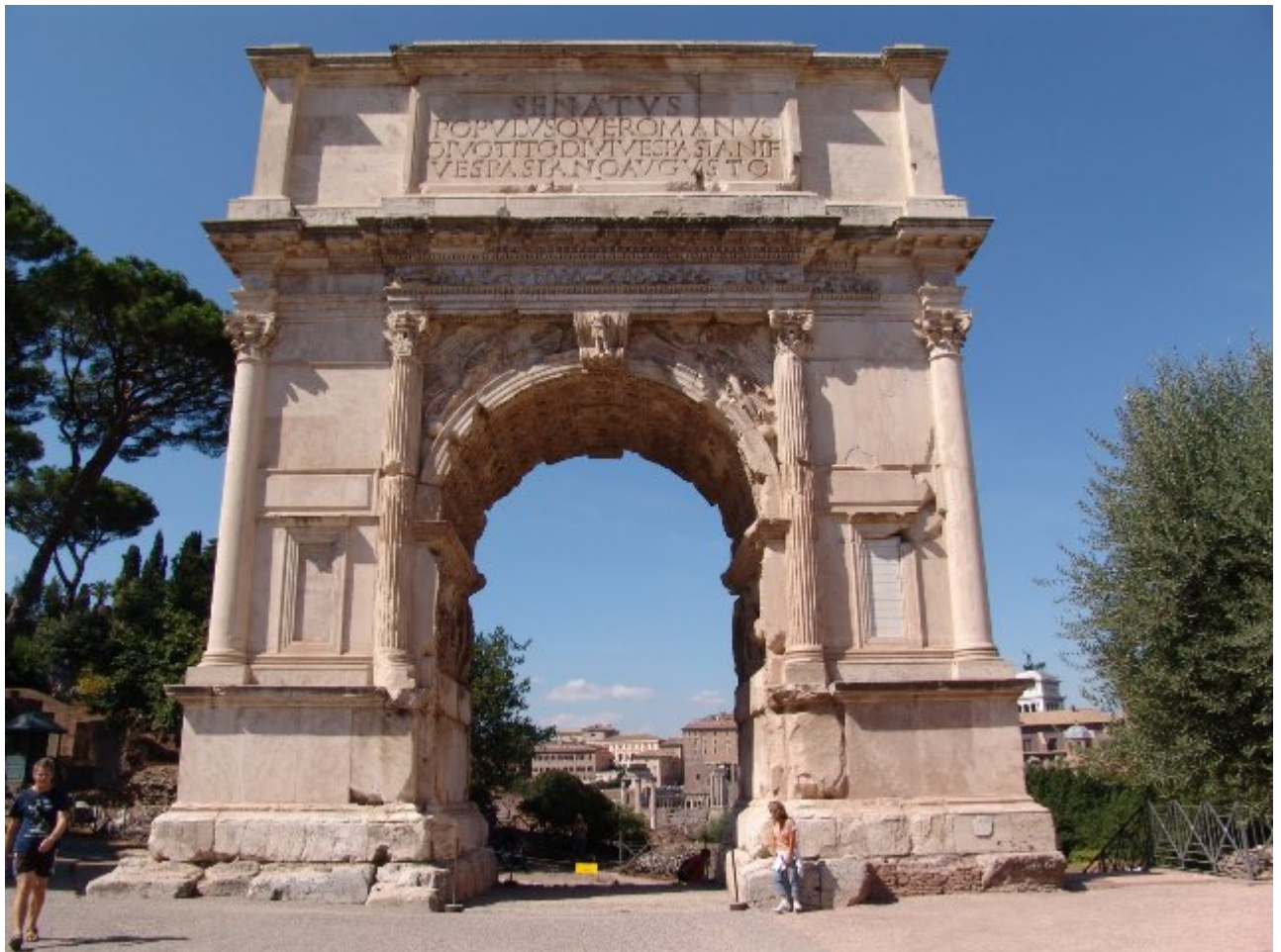
Arco di Tito a Roma

chiuderla, rimasero di guardia armati in grande-numero davanti alla soglia. Mentre da un'altra parte si combatteva molto aspramente, all'improvviso corse la voce che i nostri erano stati sbaragliati da Tazio. A questa notizia i Romani che difendevano l'accesso fuggirono atterriti. Quando però i Sabini stavano per irrompere attraverso la porta aperta, si dice che da tempio di Giano uscirono, attraverso questa porta, torrenti impetuosi dalle acque gorgoglianti e molte schiere nemiche perirono bruciate dai flutti bollenti o inghiottite dai gorgi travolgenti. In seguito a ciò si decretò che in tempo di guerra le porte del tempio restassero aperte ...”.