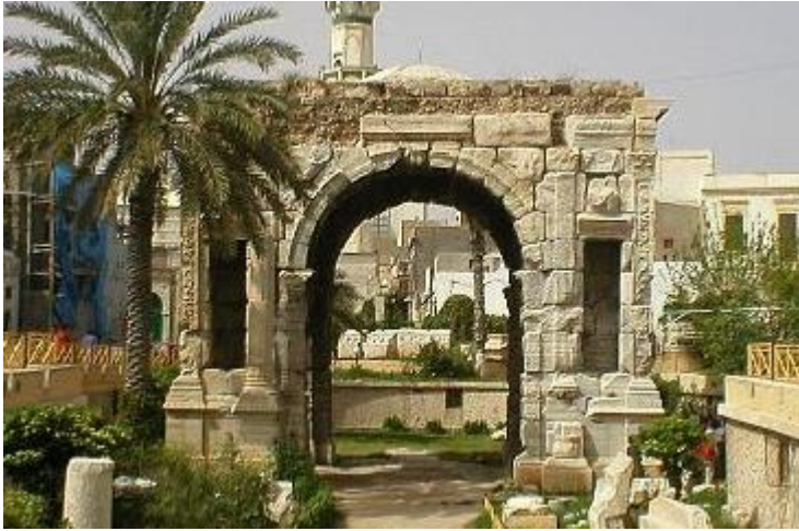
Arco di Marco Aurelio a Tripoli

L'Arco di Trionfo a Roma è, prima di tutto, Porta Sacra di un itinerario spirituale