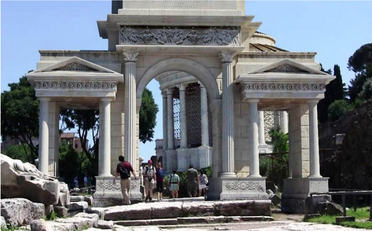
Arco di Augusto, ricostruzione

L'Arco di Trionfo a Roma è, prima di tutto, Porta Sacra di un itinerario spirituale