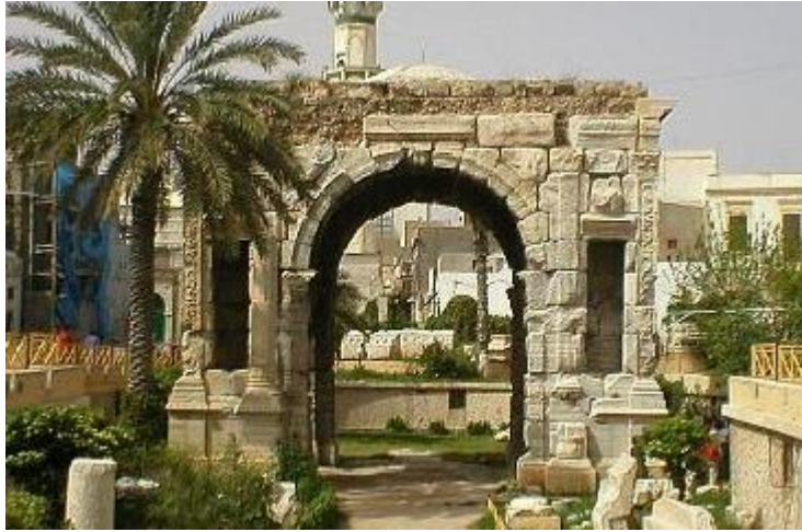
Arco di Marco Aurelio a Tripoli

L'Arco di Trionfo a Roma è, prima di tutto, Porta Sacra di un itinerario spirituale