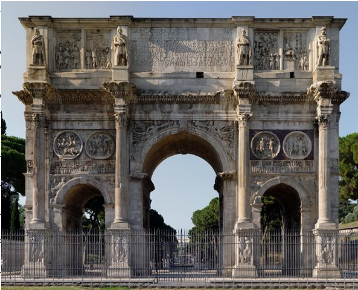
Arco di Costantino a Roma

Ulteri ori archi erano quello di Marco Aureli o sulla Via Flami nia, di Tiberi o accant o al Portic o da Ottavi a, di Druso vicino al la Porta Ardea tina, di Camill o nel