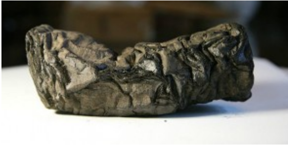
Un papiro di Ercolano

Esclusivo: hanno scoperto come leggere i papiri di Ercolano. E se tra i 1800 rotoli trovassero i libri di Varrone?