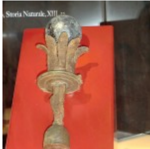
Lo scettro fatto nascondere da Massenzio

Siamo giunti quindi al complesso Curia-Comitium lo spazio politico e giudiziario della Roma del VI secolo a.c. All'interno della Curia c'era l'esposizione dello scettro di Massenzio il simbolo del potere della paganitas romana mai più trasmesso ad alcun sovrano.