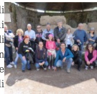
All'Ara del Divo Giulio

soffermandoci all'ara ricostruita grazie agli scavi archeologici di Giacomo Boni tra il 1898/99. L'ara di Cesare è il luogo in cui Cesare è stato cremato, inseguito alla morte avvenuta per mano di Bruto, figlio di Servilia, amante di Cesare, quindi per mano di un suo probabile figlio. La morte di Cesare per noi ha un evidente valore politico ma anche e soprattutto storico nel significato di morte come sacrificio per il passaggio.